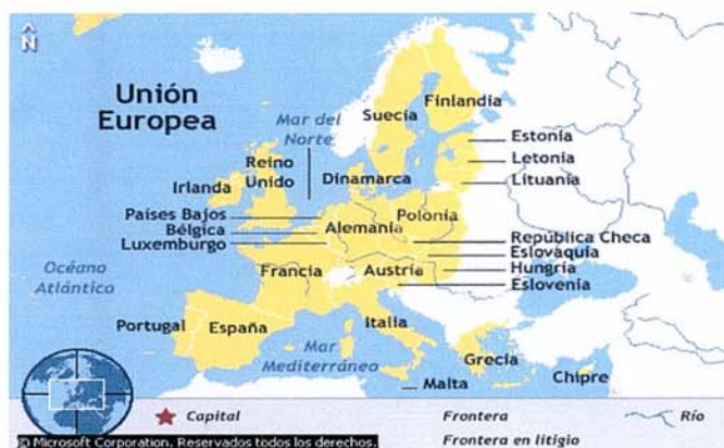
Cuadro 4.3.- Población de la Unión Europea (previsiones de crecimiento de la población en 2050, en relación al 2004. (Diario Frontera, 10-04-2005).