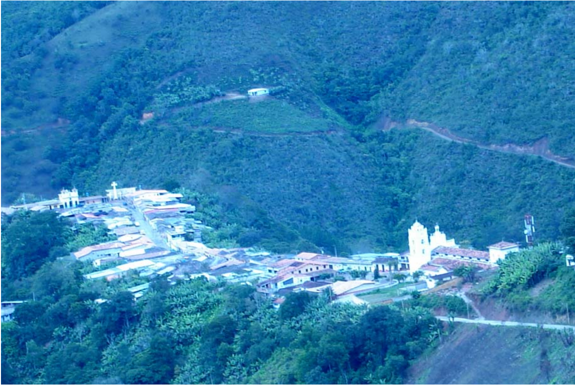
Pueblo de Guaraque (2009). 16