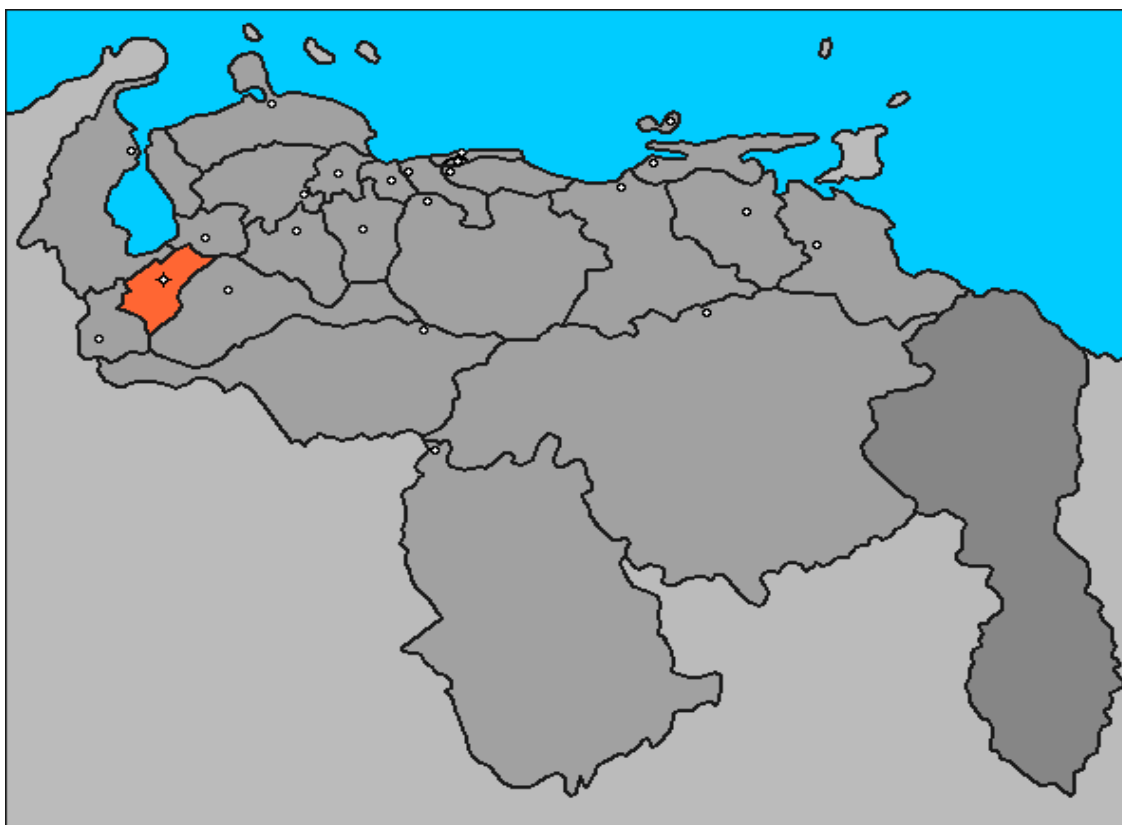
Venezuela-ubicación de Mérida. 5