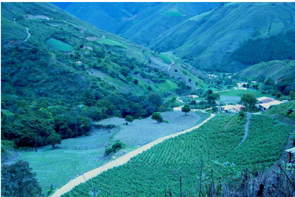
El Rincón del Hato – Guaraque. (2009). 32