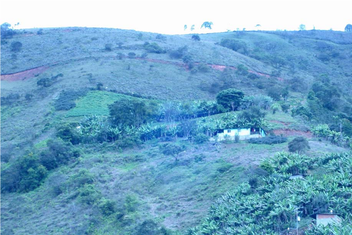
Loma Redonda- Guaraque. (2009) 62